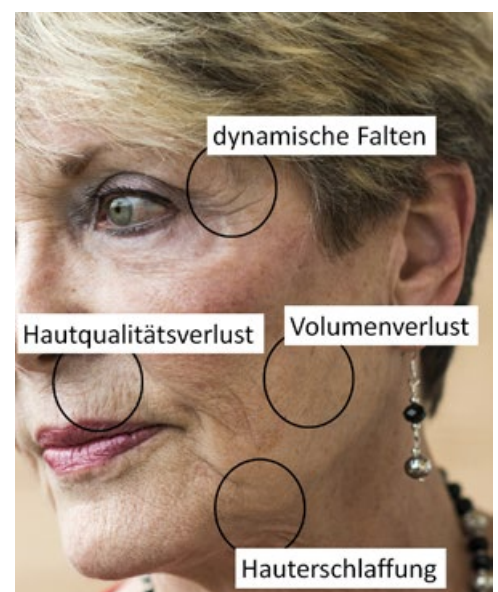
Natürliche Alterung: Die typischen Zeichen entstehen durch äußere und innere Faktoren