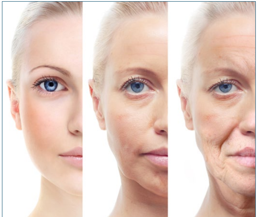
Ästhetische Biografie-Arbeit: Wird man bei den ersten Anzeichen aktiv, lässt sich der Alterungsprozess vergleichsweise sanft und gezielt entschleunigen

Mit der Technik des Liquid Liftings (=Rekonstruktion verlorengegangener Fettdepots im Gesicht) kann der erfahrene Behandler indirekt Gesichtspartien anheben. Soll es aber natürlich aussehen, dann sind diesem Verfahren klare Grenzen gesetzt. Betrachten wir beispielhaft die Zone um den Wangenknochen: Bereits in den Dreißigern beginnt um das Auge herum der Abbau formgebender Fettdepots. Gleichzeitig verlieren die Bindegewebe-