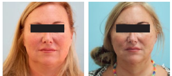
Effektiv kombiniert: Konturierung des Mittelgesichts mit Fadenlifting, Radiofrequenzbehandlung der Kinnregion (links: vorher)